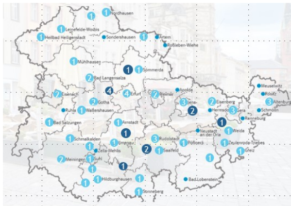
Abfrage der 21 Th. Landkreise, kreisfreien Städte und Regionen zu Initiativen, Projekten und Vereinen im Rahmen der Innenstadtentwicklung

Ziffern: Anzahl der Nennungen ● Städtisches Einzugsgebiet ● Regionales Einzugsgebiet